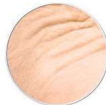
Falten erschlafte Haut