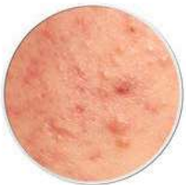
Pickel Mitesser Entzündungen