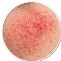
Rote Haut Ärderchen Couperose