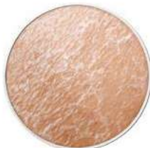
Spannungsgefühl trockene Haut schuppige Haut